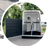
> Pont porte arrière de série